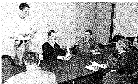
「日本語や日本文化を学ぶ経験を 大切にしたい」などと抱負を語る スイスの大学生ら＝石川県庁で

石川県国際交流協会 のプログラムで、金沢 市内でホームステイし ながら日本語を学ば れる来県したスイス人 学生三人が七日、県 庁を訪れた。三国栄・ 観光交流局長は「県内 に伝統文化が残って おり文化研修にも最 適。着実に実力をつけ